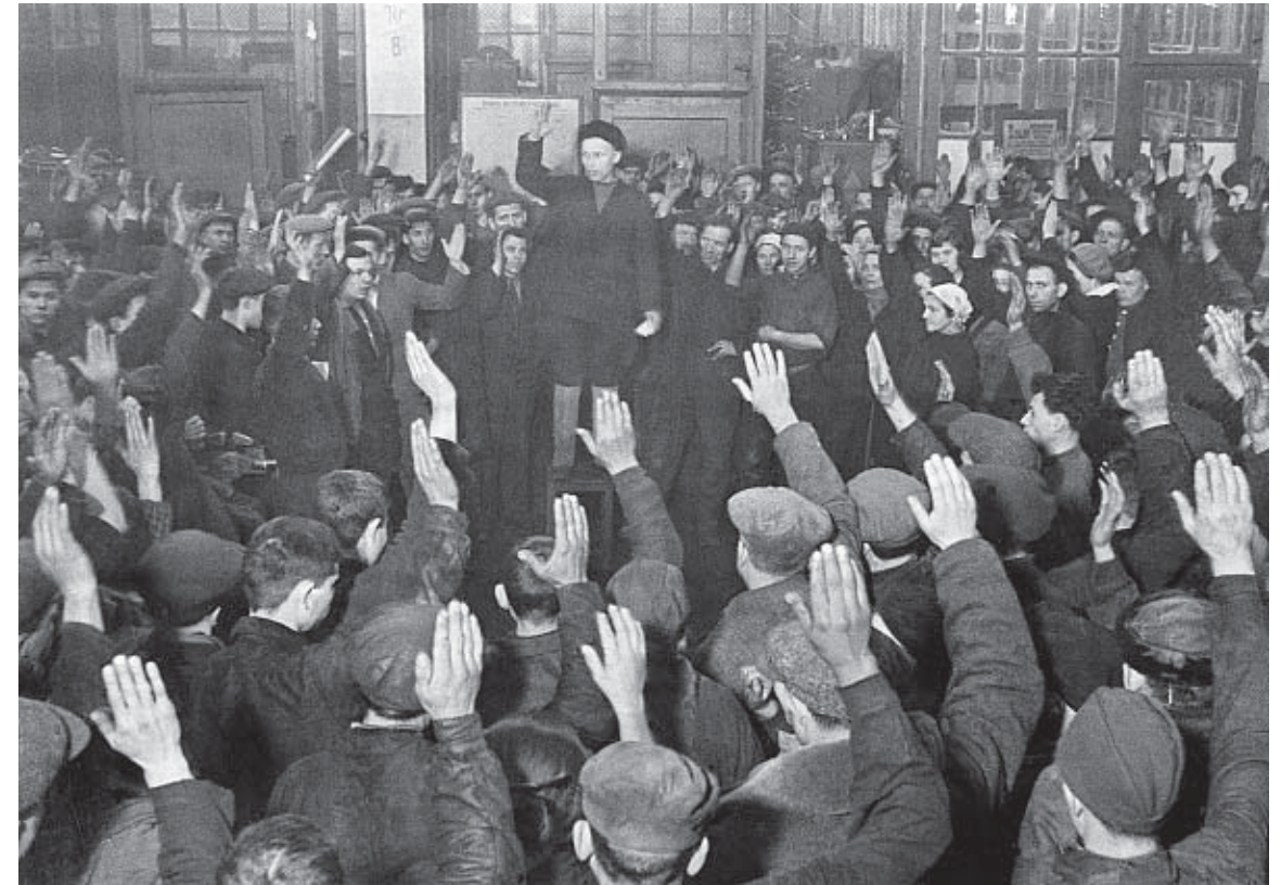
Fabrieksarbeiders in Moskou stemmen in januari 1937 voor een besluit om militaire spionnen en saboteurs te executeren.